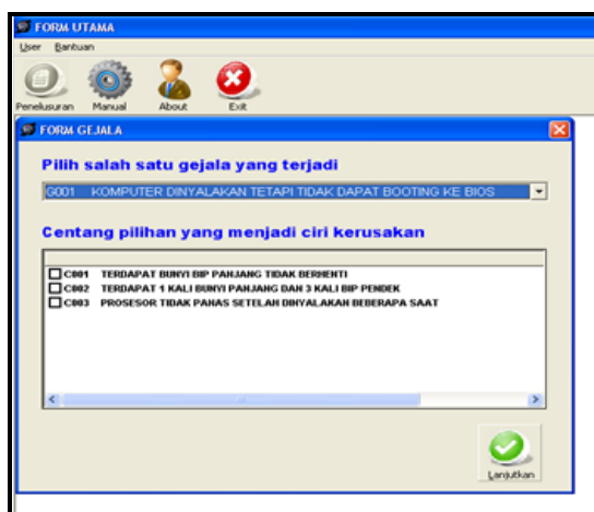
Gambar 2. Form Penelusuran Kasus Kerusakan Komputer

Fungsi penting dalam perangkat lunak ini adalah melakukan proses penelusuran dengan fungsi untuk melakukan proses mengmasukakan permasalahan mengenai gejala dan ciri kerusakan komponen komputer. Pada form penelusuran ini terdapat beberapa proses yang akan terjadi, yaitu proses memasukkan item gejala saat form penelusuran mulai pertama kali. Juga terdapat proses pengmasukanan daftar list ciri saat gejala pada combo box dipilih oleh pengguna (Gambar 1).